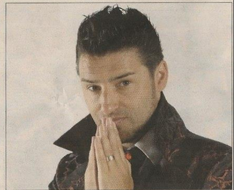
Le contre-ténor Dayan.

Pratique - Concert unique, samedi 12 octobre, à 20h30, dans l'église de Vern-d'Anjou. Tarif : 8€ et 5€ pour les moins de 12 ans. Réservations possibles au 0241953052 ou 0683204289.